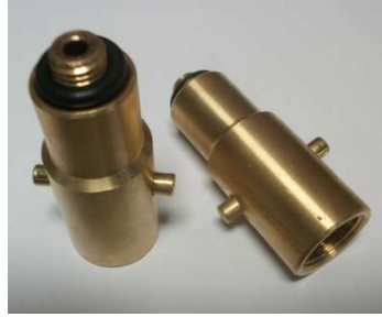
Adaptateur type baionnette (Belgique)