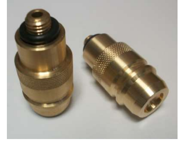
Adaptateur type Europe (Espagne)

2- Insérer le petit pas de vis dans la coupelle du remplissage de votre camping-car.