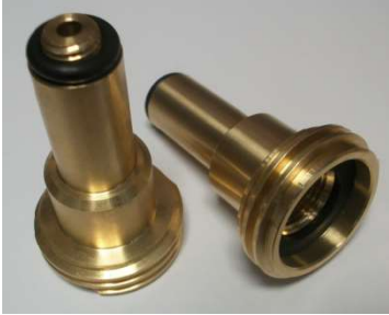
Adaptateur type ACME (pays bas)

1- Contrôler que les joints soient bien en place :