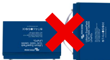
Toutes les batteries (4)